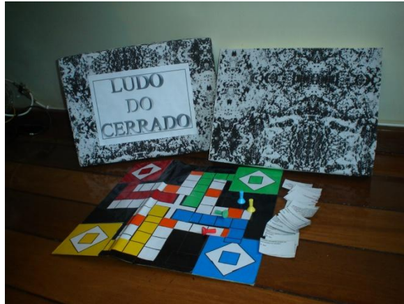
Figura 2 – Ludo do Cerrado