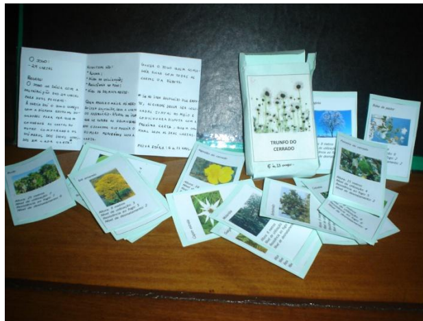
Figura 1 – Trunfo do Cerrado.

categoria e fala quanto ela vale para o adversário. Ganha a carta aquele que tiver o maior valor, com exceção da categoria desmatamento, que ganha a carta o menor valor. Ganha o jogo quem ficar com todas as cartas. Caso as cartas escolhidas tenham valores iguais, elas ficam juntas no meio e o desempate será feito na próxima jogada, quem ganha leva a carta da jogada e as duas anteriores. As cartas de cada jogada serão repostas no final do baralho. Faixa etária de 6 a 13 anos. Temática - flora do Cerrado.