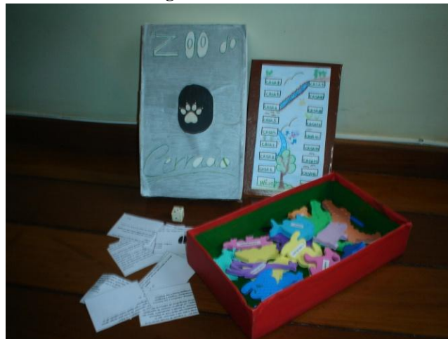
Figura 4 – Zoo do Cerrado

para três pessoas, dois competidores e outro que faz as perguntas (banca) e libera os animais. Os animais serão conquistados se o jogador responder corretamente as perguntas, para isso um pião deve avançar em um tabuleiro onde cada casa corresponde uma pergunta ou informação. Vence aquele que coletou mais animais da fauna brasileira, pois ele deve saber distinguir os animais intrusos. Faixa etária a partir dos 10 anos. Temática – fauna do Cerrado.